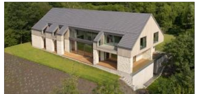
Bryła przywołuje na myśl kształt dworu z gankiem i alkierzami