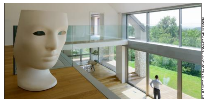
Otwarte wnętrza i duże przeszklenia pozwalają podziwiać otoczenie