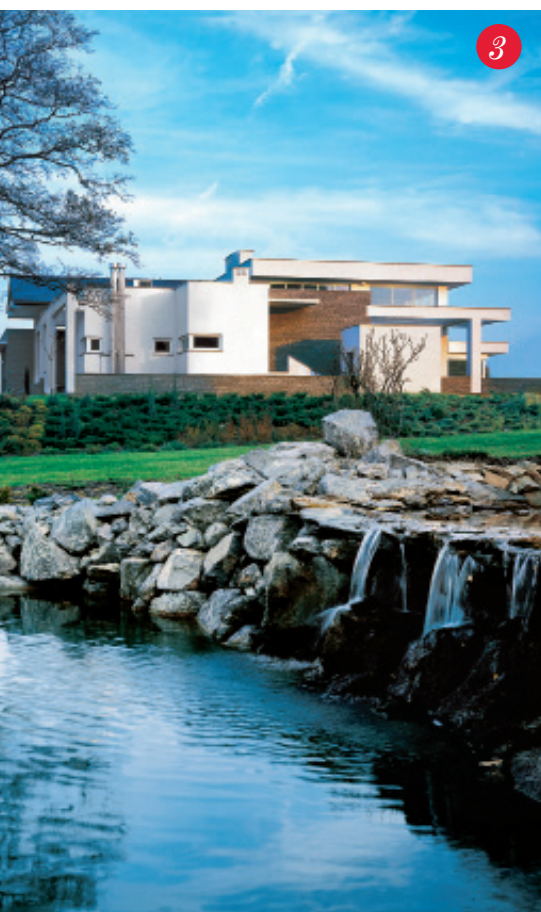
3., 6. Rezydencja z zespołem parkowym w Niepołomicach koło Krakowa, 2004

TEKST AGNIESZKA GRUSZCZYŃSKA-HYC