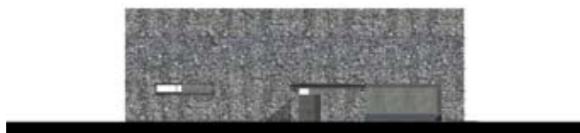
ELEWACJA FRONTOWA: WYGLĄDA JAK SKALNY MONOLIT. KONTAKT Z OTOCZENIEM ZAPEWNIĄJĄ OKNA TYPU WSTĘGOWEGO O MODERNISTYCZNYM RODOWODZIE