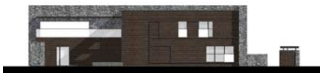
ELEWACJA OGRODOWA: TU NAJLEPIEJ WIDAĆ GRĘ DWÓCH MATERIAŁÓW – CIEPŁEGO GONTU I ASCETYCZNEGO KAMIENIA