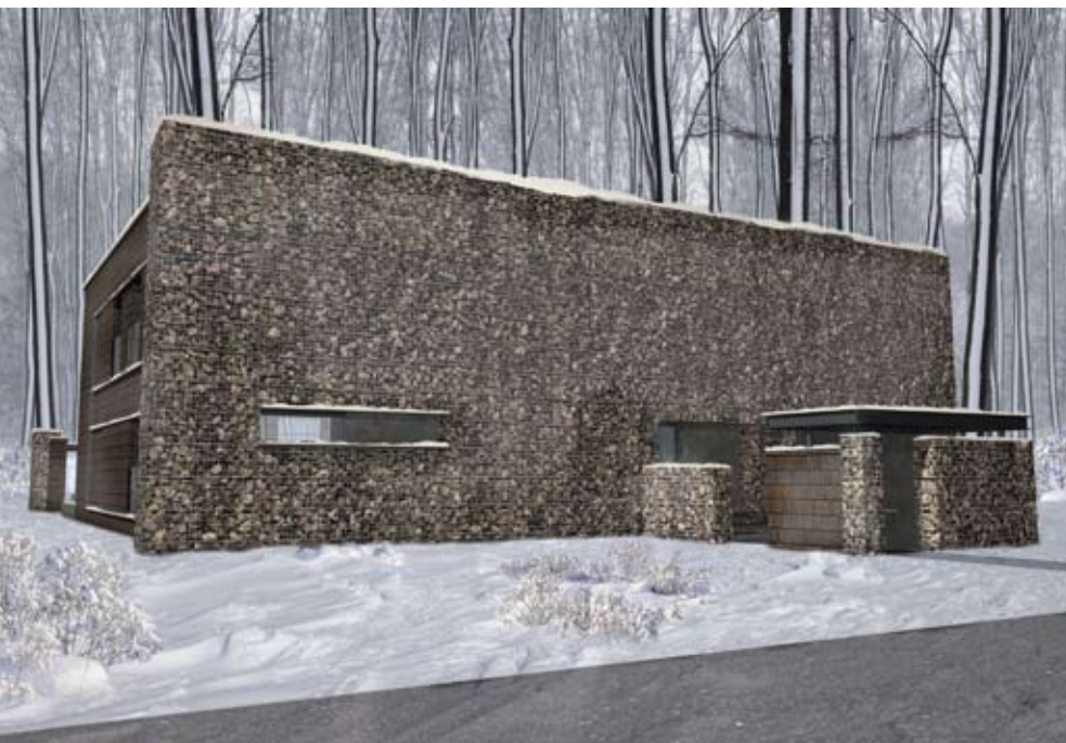
ELEWACJA FRONTOWA: JEST JAK TWIERDZA, OSŁANIA PRZED WZROKIEM PRZECHODNIÓW I DAJE MIESZKAŃCOM POCZUCIE BEZPIECZEŃSTWA