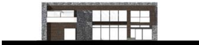
ELEWACJA OGRODOWA: WIELKIE PRZESZKLENIA O UPORZĄDKOWANYM RYTMIE ZAPEWNIĄJĄ ROZLEGŁĄ PANORAMĘ