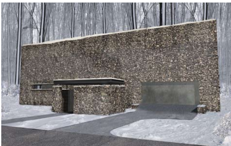
ELEWACJA FRONTOWA: OD STRONY ULICY UWAGĘ ZWRACA FAKTURALNA RZEŻBIARSKA ELEWACJA DOMU