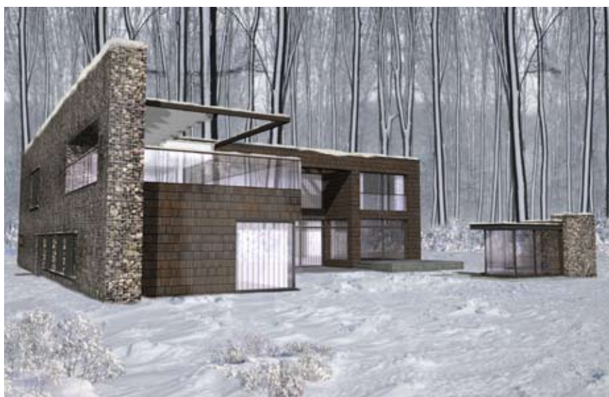
ELEWACJA OGRODOWA: HARMONIJNA BRYŁA DOBRZE KOMPONUJE SIĘ Z OTOCZENIEM