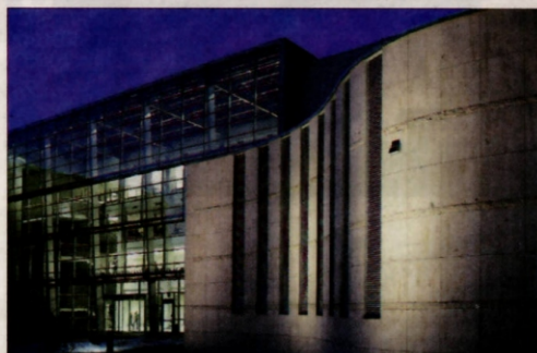
III Kampus UJ, gmach Wydziału Zarządzania (Biuro Architektoniczne EKSPD)