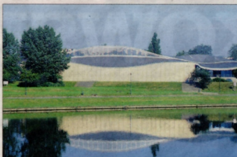
Centrum Sztuki i Techniki Japońskiej Manggha (Biuro Architektoniczne INGARDEN & EWY)